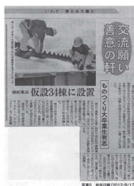
写真2 (2012/8/7)